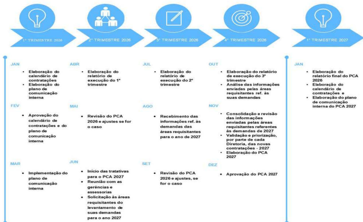
Figura 3 – Cronograma de atividades do PCA

O cronograma de atividades se estabelece como um elemento crucial para o monitoramento contínuo do PCA, desempenhando um papel fundamental no direcionamento ordenado e eficiente de todas as fases do processo de contratação. Nesse sentido, o cronograma a seguir estabelece uma linha temporal clara, fornecendo um meio eficaz para o cumprimento dos prazos determinantes: