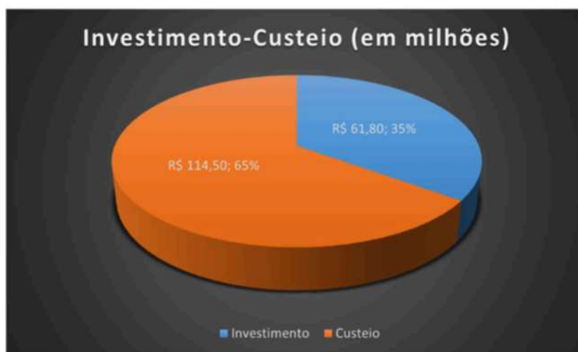
Gráfico 1 – PO 2025

máquinas e equipamentos; R$ 2,7 para equipamentos e sistemas de tecnologia da informação; R$ 47,5 para investimentos em sistemas de comunicação e R$ 4,0 milhões em imobilizado (adequações de bens imóveis).